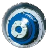
Držák unašeče padů a kartáče