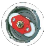
Planetární převodovka (M16)