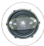
Planetární převodovka (M22)