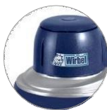
Nový plastový kryt (M22)