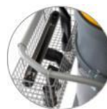
Praktický koš na příslušenství