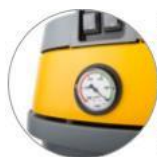
Ukazatel zatížení filtru