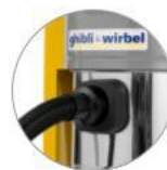
Přívod/vstup hadice Ø 90 (AS 40 KS)