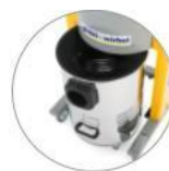
Odnímatelný, pojezdný sběrný kontejner