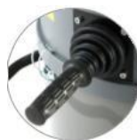
Manuální oklep filtru