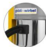
Přívod/vstup hadice Ø 50 (AS 40 KS M/H)